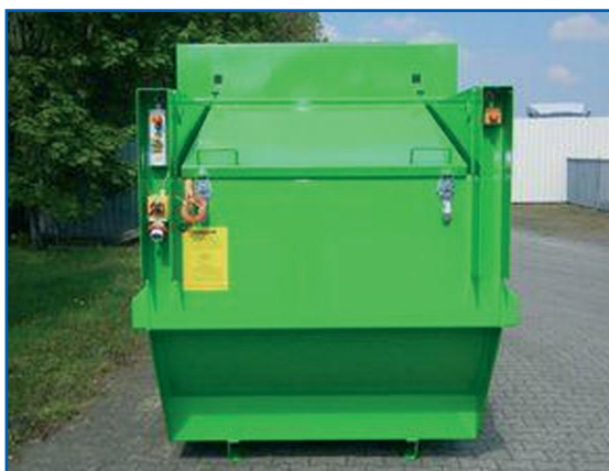
• Загрузочное окно